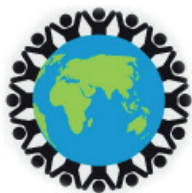
Destination universelle des biens