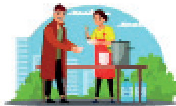
Option préférentielle pour les pauvres