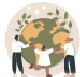
Bonne intendance de la création