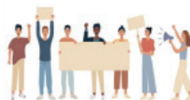
Droits et responsabilités