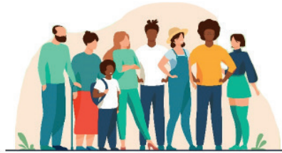
Dignité des personnes