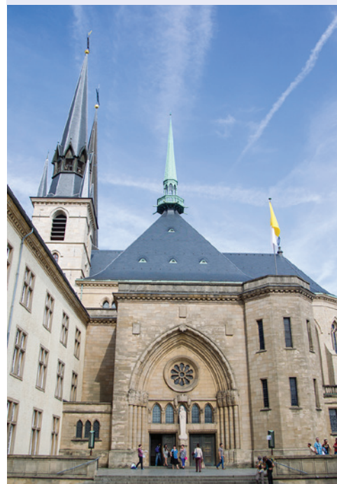
Cathédrale Notre-Dame de Luxembourg